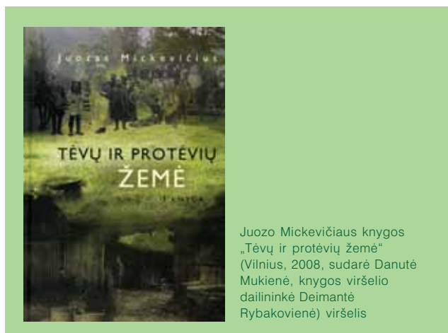
Juozo Mickevičiaus knygos „Tėvų ir protėvių žemė“ (Vilnius, 2008, sudarė Danutė Mukienė, knygos viršelio dailininkė Deimantė Rybakovienė) viršelis