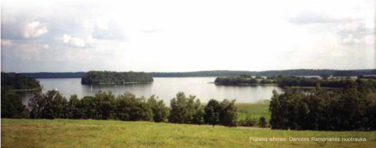
Platelių ežeras.