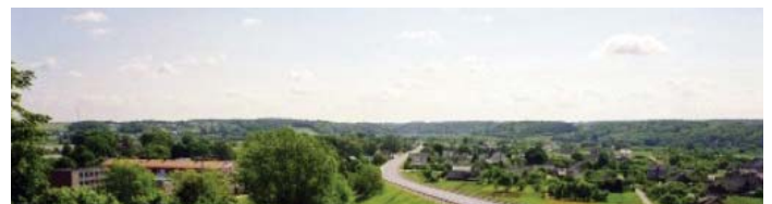
Kartena.

Ypatingai sunkus buvo baudžiauninkų, priklausiusių Mišučių dvarui, gyvenimas. Jie ne kartą rašė skundus dvaro savininkui Sapiegai, kuriuose nurodydavo, kad dvaro valdytojas juos tiek skriaudžia, jog daugelis nebeiškeičia ir bėga iš sodybų. 1717–1718 m. rašytame skunde sakoma, kad nei karo su švedais metu, nei maro metu ne-